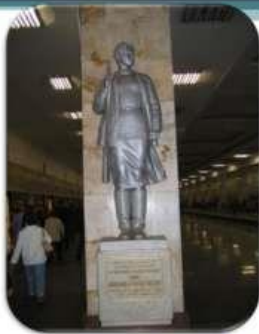
Памятник на станции метро «Партизанская».