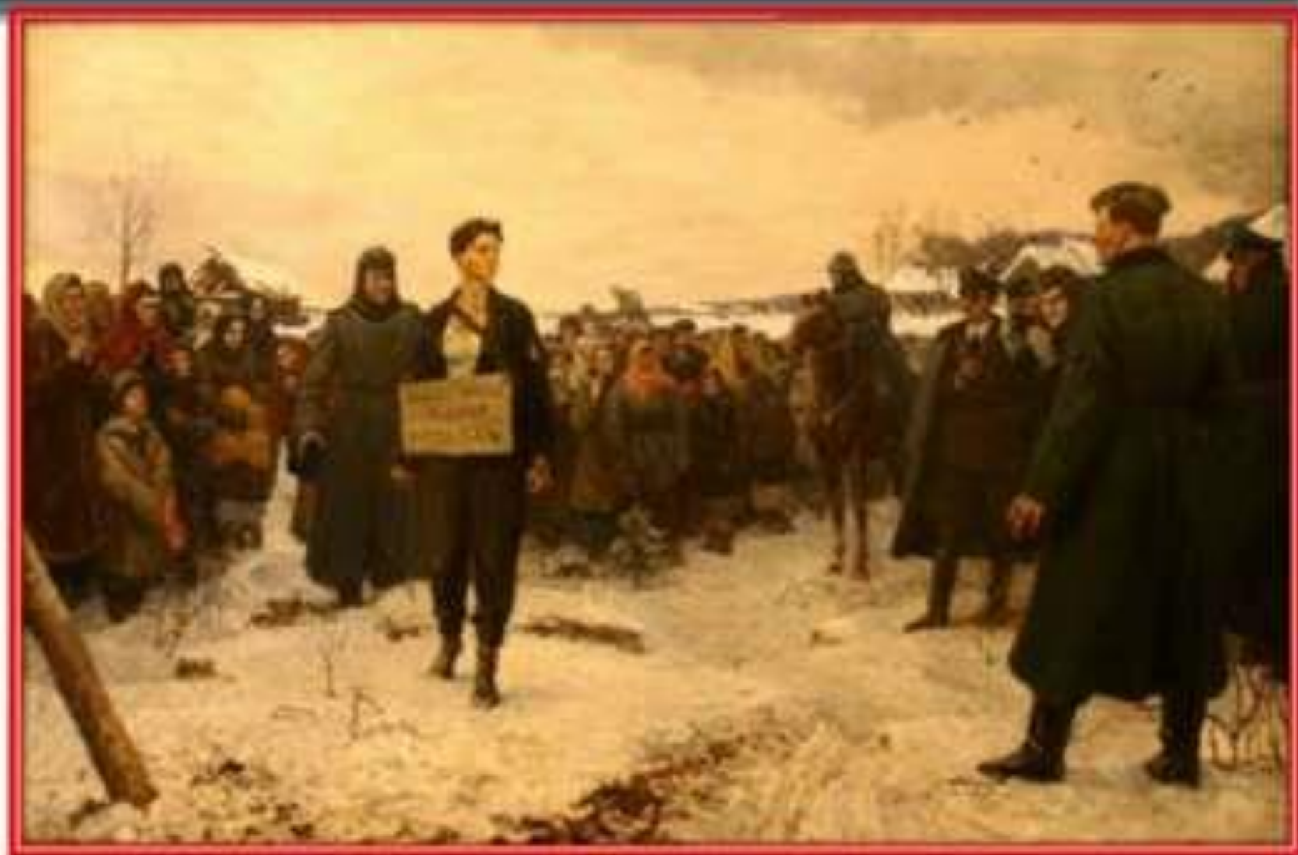
Художник: К. Щёкотов, «Зоя Космодемьянская перед казнью».