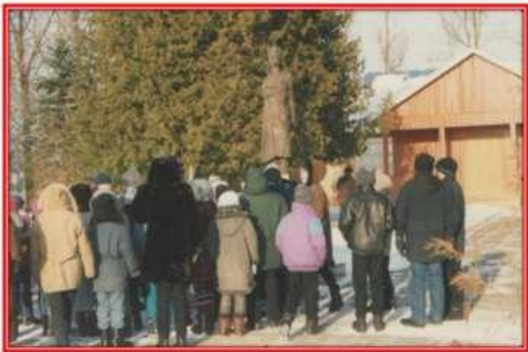
Деревня Петрищево, Памятник Зое.