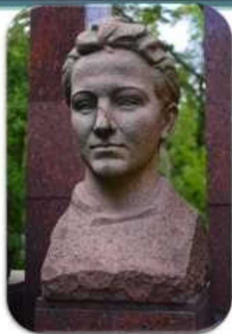
Памятник возле московской школы № 201.