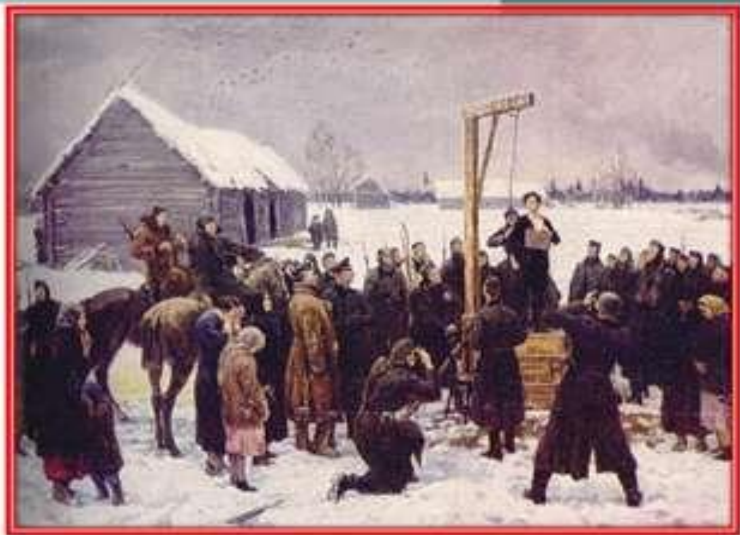
Подвиг Зои Космодемьянской.