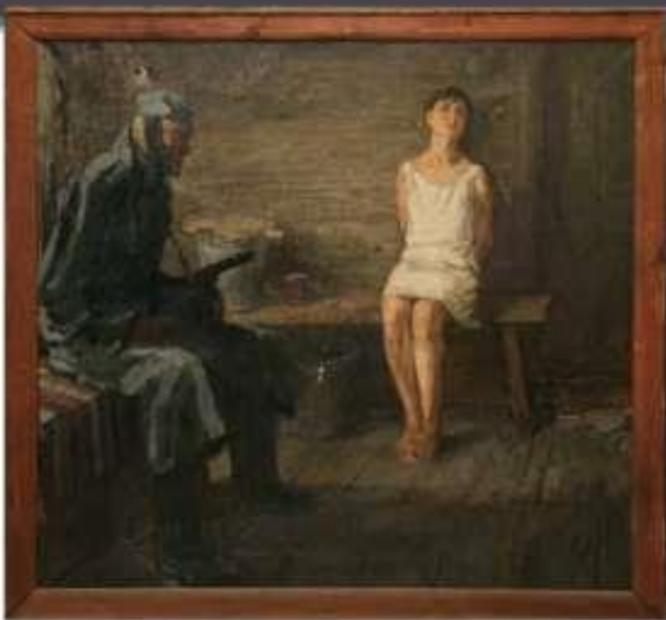
Художник: Щукин В. Г., «Зоя Космодемьянская».