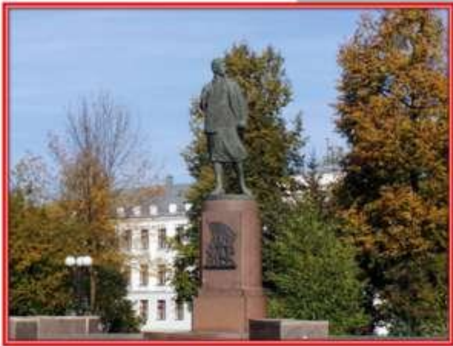
Памятник Зое Космодемьянской.