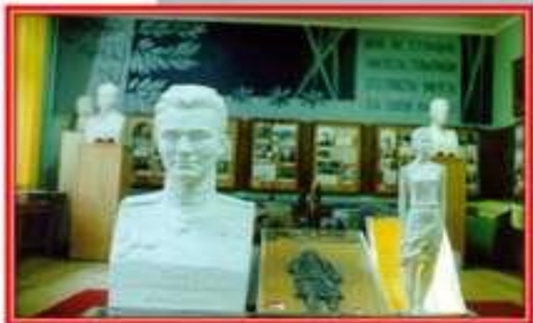
Зоя и Александр Космодемьянские.